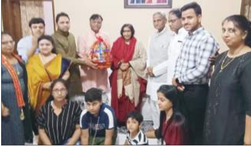
इस कारण वहाँ बार-बार जाने की इच्छा मन में होती है। वात्सल्य ग्राम जैसा सेवा प्रकल्प पूरे देश के हर जिले में होना चाहिए। उक्त बातें प्रमुख समाजसेवी व

टीम एक्शन इंडिया/नई दिल्ली वात्सल्य ग्राम साध्वी ऋतुभरा द्वारा परिकल्पित एक अनुदा ग्राम है जहां हर माता यशोदा की भाँति अपनी संतानों पर स्नेह वर्षा करते नहीं थकती और हर संतान अपनी यशोदा मैया को अपने हृदय में बसाए रहती हैं। ऐसा पुनीत स्नेह, ऐसी कोमल ममता और ऐसे हृदय संस्कार बच्चों को वात्सल्य ग्राम में प्राप्त होते हैं कि उनको जीवन में सफल होने से कोई नहीं रोक सकता। वात्सल्य ग्राम में जहाँ एक ममतामयी मौसी एक स्नेहशील नानी, एक पूर्ण रूप से समर्पित माँ के साथ मिलकर प्यार-प्यार कोमल पुष्पों को न केवल पाल पोस कर बड़ा करती है बल्कि उन्हें समाज का, देश का एक जिम्मेदार नागरिक भी बनाती है। वात्सल्य ग्राम में जाकर वहाँ के स्नेह और ममता की डोर से बंधे परिवारों से मिलकर जो सुखद अनुभूति होती है।