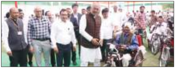
करनाल/टीएम एक्शन इंडिया। इंडियन सिंथेटिक रबर प्राइवेट लिमिटेड के सीएसआर योजना के अन्तर्गत एल्लिम्को द्वारा जिला रेडक्रॉस सोसायटी के साथ मिलकर दिव्यांगजन हेतु करनाल, पानीपत, सोनीपत में लगाए गए परीक्षण शिविरों के उपरान्त शनिवार को आर्य पी.जी. कॉलेज, पानीपत में